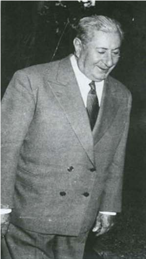
گزارش اطلاعات داخلی

موضوع: اطلاعاتی از... شماره: ۹۷۳ تاریخ: ... محل: ... تاریخ وصول: ۳۷/۴/۴۰ تاریخ گزارش: ۳۷/۴/۴۰