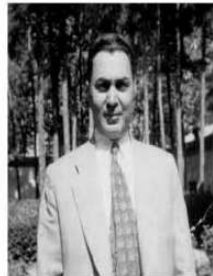
دکتر کریم سنجابی